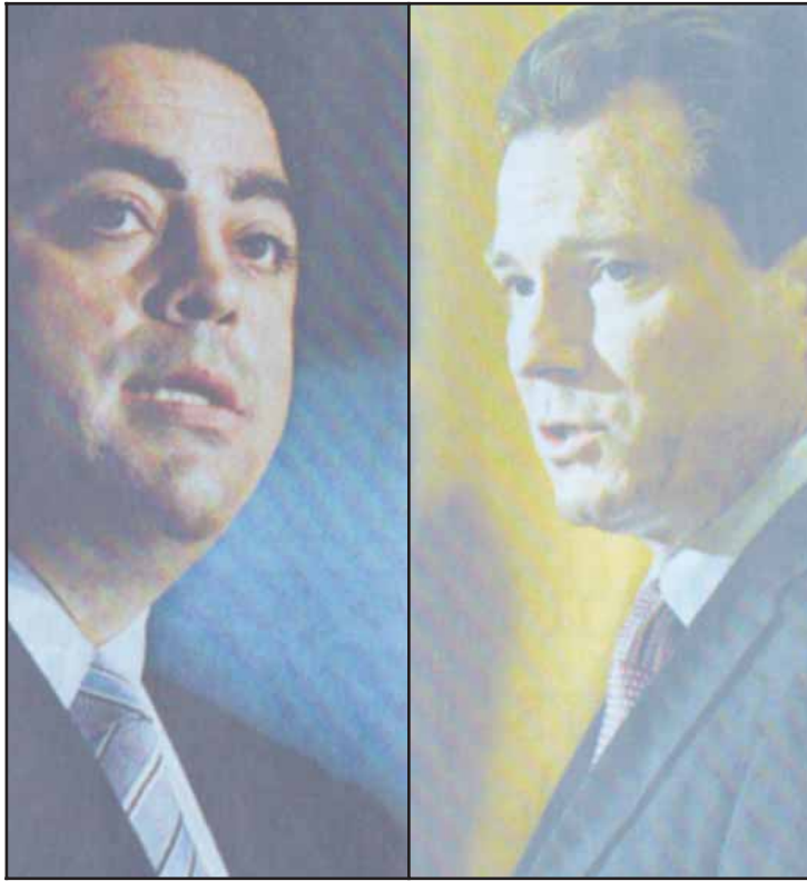
Τζο Τριπόντι και Νείθαν Ρις

Χθες, ο κ. Ρις ανακοίνωσε ανασχηματισμό της κυβέρνησής του με την υπουργό Σχεδιασμού, Κριστίνα Κενίλι, να αναλαμβάνει και το χαρτοφυλάκιο υποδομών. Ο Μάικλ Ντάλεϊ αναλαμβάνει το υπουργείο Οικονομικών, ο Θησαυροφύλακας, Ερικ Ρούζενταλ, θα έχει και το υπουργείο Πολιτικής Ανάπτυξης, ενώ ο υπουργός Γαιών, Τόνι Κέλι, αναλαμβάνει το υπουργείο Πρωτογενούς Βιομηχανίας, τού αποχωρήσαντος, Ιαν Μακντόναλντ.